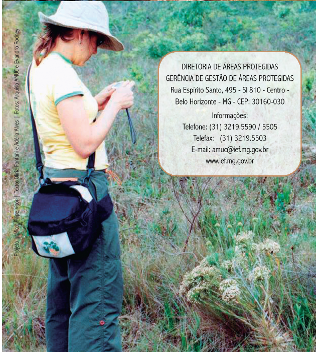
Projeto de Recreação: Felipe Mota | Banco de Informação e Admissão: Adilson Alves

DIRETORIA DE ÁREAS PROTEGIDAS GERÊNCIA DE GESTÃO DE ÁREAS PROTEGIDAS Rua Espírito Santo, 495 - SI 810 - Centro - Belo Horizonte - MG - CEP: 30160-030 Informações: Telefone: (31) 3219.5590 / 5505 Telefax: (31) 3219.5503 E-mail: amuc@ief.mg.gov.br www.ief.mg.gov.br