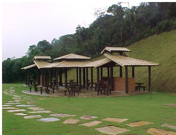
Área de lazer e camping