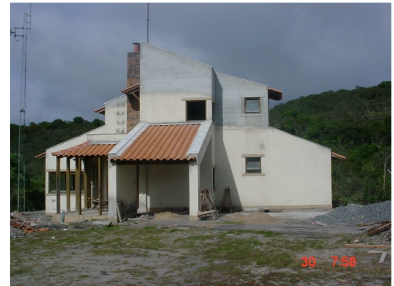
Casa de hóspedes