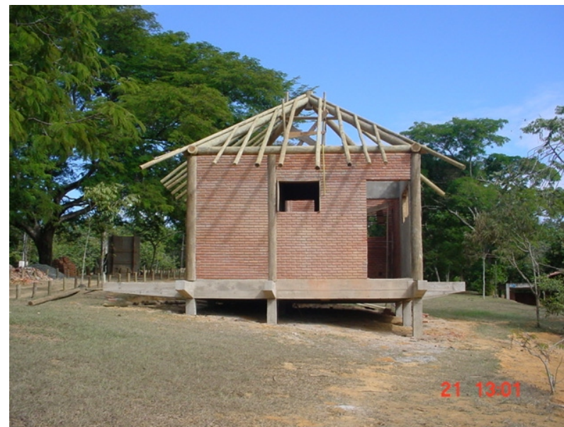
Casa administrativa - Setor de barcos