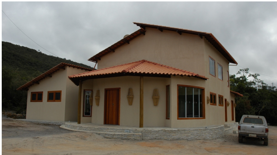
Centro de Interpretação e Administração