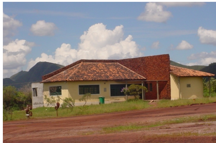
Centro de Informação