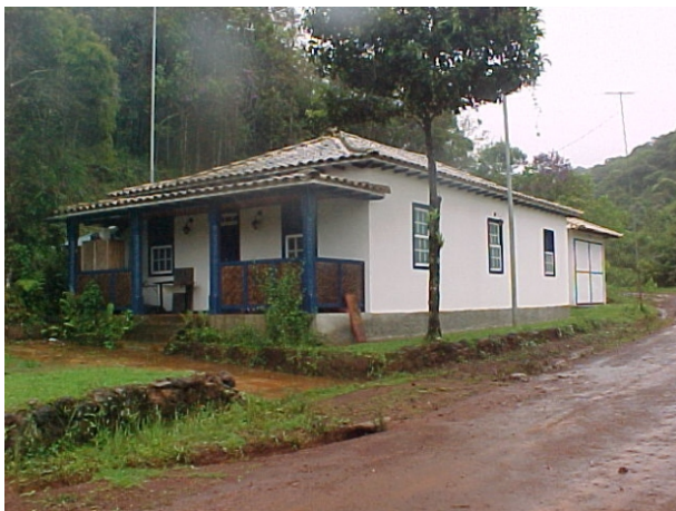
Casa do gerente