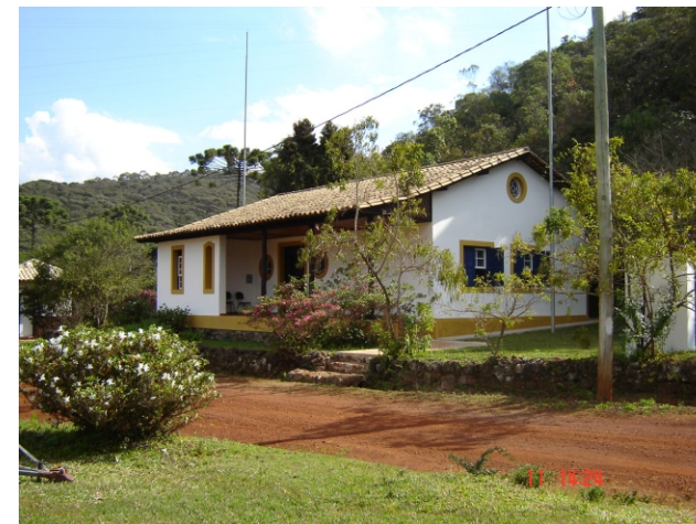
Casa de hóspedes