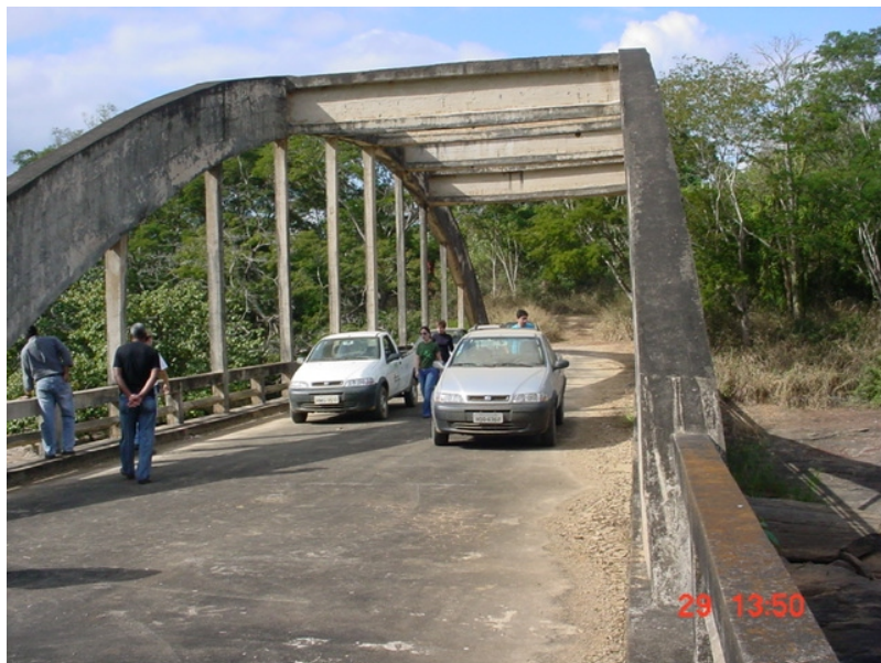
Centro de pesquisa - (Ponte do Revés)