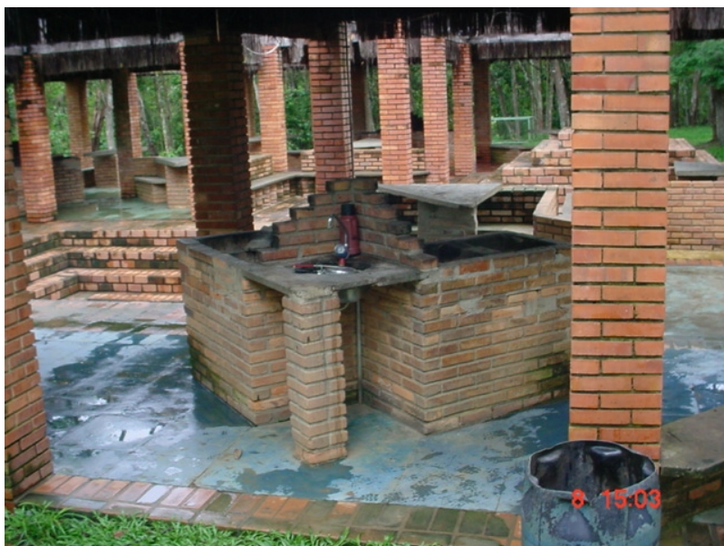
Área de camping - lazer