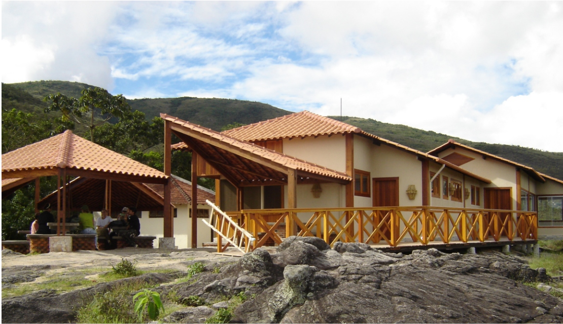
Restaurante e lanchonete