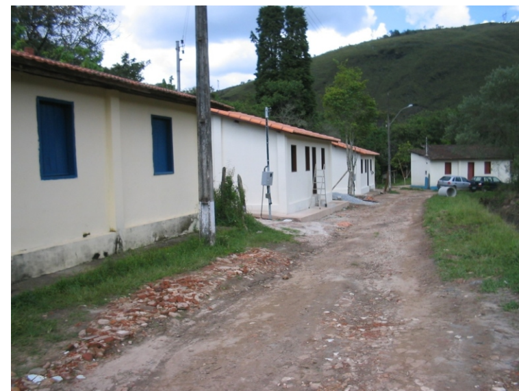
Escritório e alojamentos