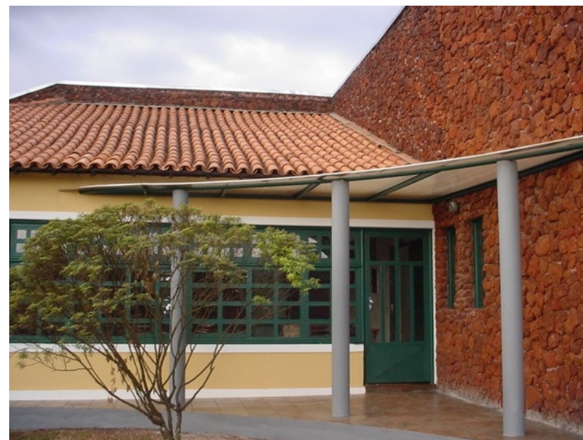
Centro de Informação