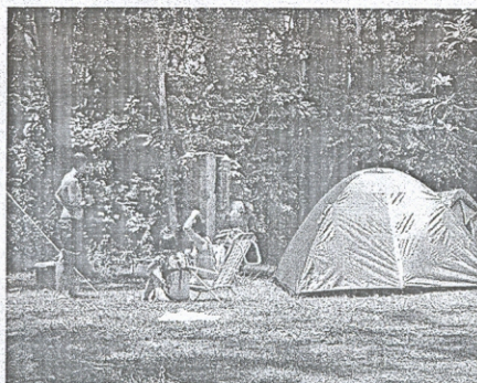
O parque possui camping para 250 barracas

Alguns programas estão incluídos no Projeto Portal: Central de Tecnologias de Casas Populares e Comunitárias; Escola / Oficina de Mobiliário Doméstico e Urbano; Museu do Povo: História e Tradições; Jardim Botânico Mata Atlântica; Museu Botânico Mata Atlântica; Centro Cultural "Shopping da Novidade" e Feira anual de móveis e construção civil.