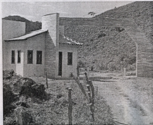
Portaria da sede Administrativa do Parque Estadual Serra do Brigadeiro, em Araponga