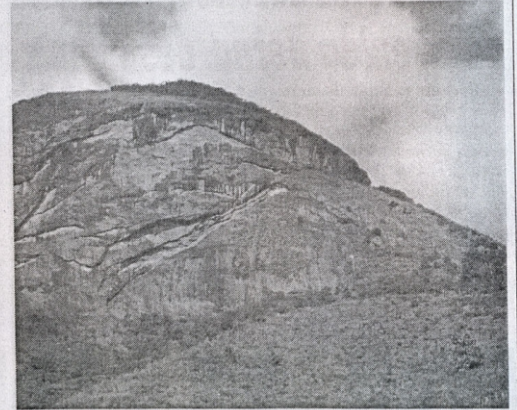
A Pedra do Pato, outra atração do novo parque