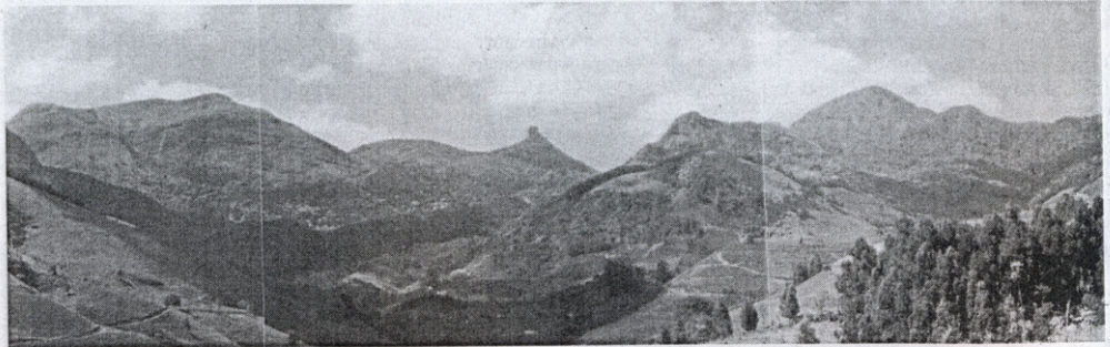
As paisagens das montanhas de Araponga estão entre as mais belas de Minas Gerais. Ao fundo o Pico do Boné

Em reunião realizada no dia 22 de fevereiro os conselheiros do PESB votaram a composição da mesa diretora do Conselho e discutiram sobre a existência de propriedades rurais na área do Parque. De acordo com os engenheiros florestais do PROMATA (Projeto de Proteção da Mata Atlântica de Minas Gerais), muitos produtores nem sabem disso. Para os conselheiros essa é uma questão preocupante, que deve ser resolvida com rapidez. Uma reunião extraordinária foi marcada para o dia 22 de março. Nela discutirão a forma de atuação do "Plano de Manejo" que visa estudar a melhor maneira de resolver a questão da retirada das famílias da área de preservação ambiental.